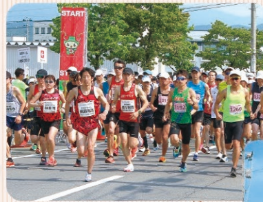
◎SAGAE SAKURANBO MARATHON