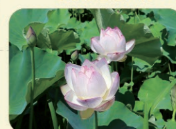
●慈恩寺 慈恩寺蓮花▶7月~8月