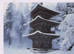
●慈恩寺 三重塔 雪景