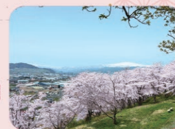
●寒河江公園 寒河江櫻花節 櫻花花季▶4月中旬~下旬