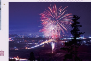
●慈恩寺 大晦日花火大會 雪月華